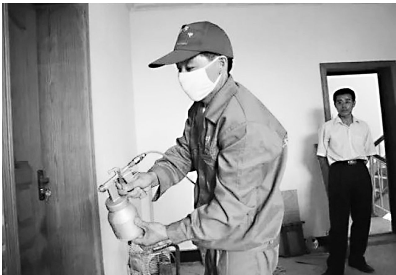
工作人员采取除甲醛措施(资料图)

有业内人士表示,因相关标准的滞后以及标准监管力度不足,家装产品进入门槛较低,一方面造成目前装修市场、环保材料鱼目混珠,另一方面,商家、装修公司等又多因成本控制采用部分不合规产品,更不会主动采取除甲醛等措施,造成了装修污染现象频现。